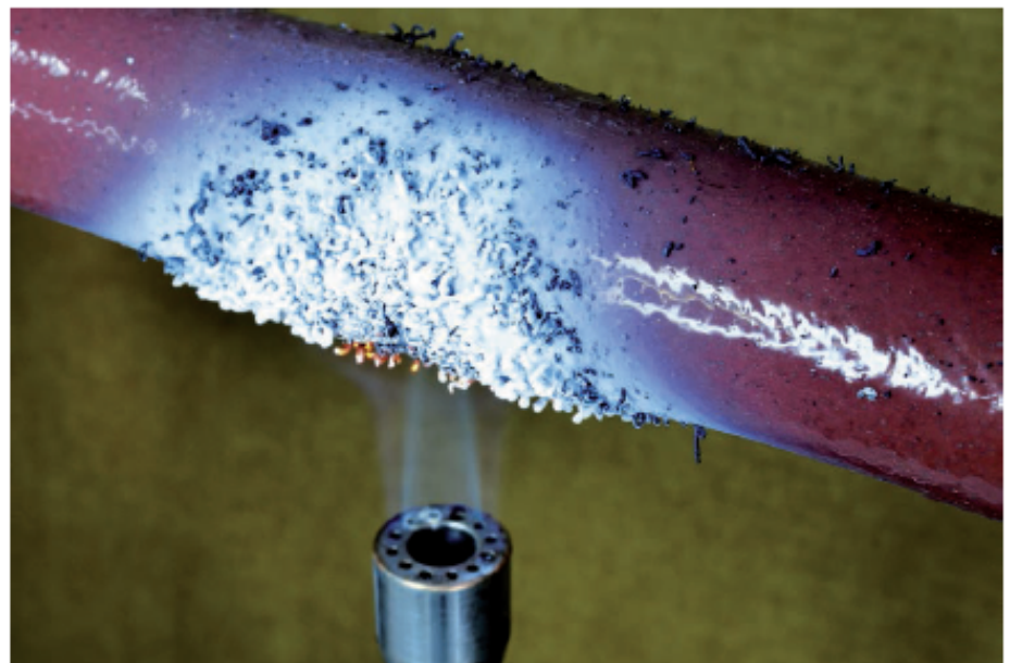
BILD 1: Selbstverlöschender Schlauch VSCTF von RELATS*/ Albert Schweizer KG

RELATS* hat in Zusammenarbeit mit der Fa. Albert Schweizer KG eine spezielle Silikonbeschichtung für das Glasfasergeflecht »